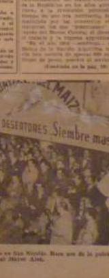
Asistentes de la concentración en San Nicolás, con motivo del 100º aniversario de la Nación, dirigidos por el Sr. General Perón.

El Sr. Aloé, en un momento de su discurso, expresó lo siguiente: "El hombre de campo es el pilar de nuestra economía y su bienestar es el objetivo primordial de nuestra política." El Sr. Aloé, en su discurso, recordará los hechos que dieron origen a la Revolución del '73 y la importancia que tiene para el pueblo argentino el haber alcanzado la independencia política y económica.