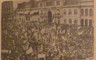
El acto central de la conmemoración del 17 de Octubre, en el Estadio de Marilín, con la asistencia del Sr. General Perón.

La conmemoración del 17 de Octubre alcanzará este año, como en oportunidades anteriores, un grado extraordinario de solemnidad. El Comandante en Jefe del Ejército, General Perón, que será el invitado principal de la fiesta, se dirigirá a la multitud en un acto que tendrá lugar en el Estadio de Marilín, que será sede de la gran concentración de los descendientes peronistas con la asistencia del Sr. General Perón. El acto central será presidido por el Sr. General Perón, quien se dirigirá a la multitud en un momento que será de gran importancia. El Sr. General Perón, en su discurso, recordará los hechos que dieron origen a la Revolución del '73 y la importancia que tiene para el pueblo argentino el haber alcanzado la independencia política y económica. El Sr. General Perón, en su discurso, recordará los hechos que dieron origen a la Revolución del '73 y la importancia que tiene para el pueblo argentino el haber alcanzado la independencia política y económica.