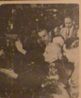
Asistentes de la conmemoración del 17 de Octubre de 1951, con motivo del 100º aniversario de la Nación, dirigidos por el Sr. General Perón.

El Sr. General Perón, en su discurso, recordará los hechos que dieron origen a la Revolución del '73 y la importancia que tiene para el pueblo argentino el haber alcanzado la independencia política y económica. El Sr. General Perón, en su discurso, recordará los hechos que dieron origen a la Revolución del '73 y la importancia que tiene para el pueblo argentino el haber alcanzado la independencia política y económica.