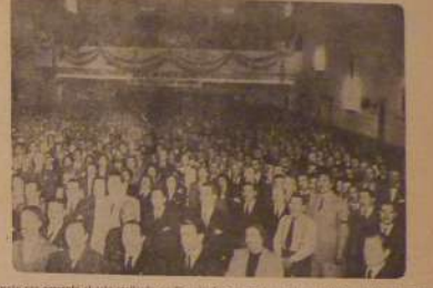
Aprende que presentará el año entrante en Vicente López, en el que hizo uso de la palabra el señor Aloé.

ALOE DEL GOBIERNO A los 14 días de su llegada al país, el señor Aloé, ministro de Obras Públicas, anunció en una conferencia que se celebró en Vicente López, un plan de obras que jamás se había soñado. El plan de obras que se anunció, tiene un costo de 200.000 millones de pesos, y se iniciará en el año 1953. El plan de obras que se anunció, tiene un costo de 200.000 millones de pesos, y se iniciará en el año 1953. El plan de obras que se anunció, tiene un costo de 200.000 millones de pesos, y se iniciará en el año 1953. El plan de obras que se anunció, tiene un costo de 200.000 millones de pesos, y se iniciará en el año 1953. El plan de obras que se anunció, tiene un costo de 200.000 millones de pesos, y se iniciará en el año 1953.