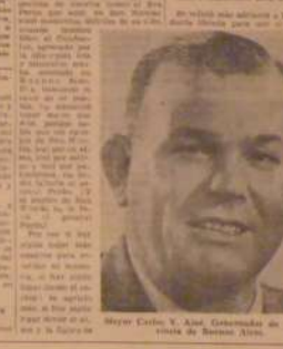
Sr. Aloé, en un momento de su discurso, expresó lo siguiente: "El hombre de campo es el pilar de nuestra economía..."

Con la concentración de San Nicolás, el Sr. General Perón, en un momento de su discurso, expresó lo siguiente: "El hombre de campo es el pilar de nuestra economía y su bienestar es el objetivo primordial de nuestra política." El Sr. General Perón, en su discurso, recordará los hechos que dieron origen a la Revolución del '73 y la importancia que tiene para el pueblo argentino el haber alcanzado la independencia política y económica.