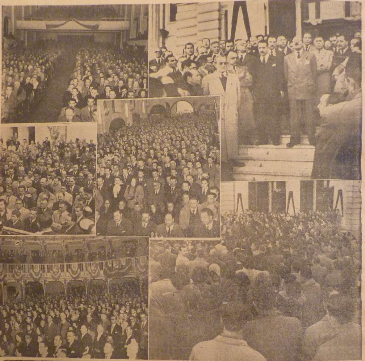
El peronismo de la provincia, fiel a su líder y a los postulados de la Revolución Nacional que él encarna, se hizo presente en los actos que lo intervencionalista realizó, en distintas localidades, con fervor y entusiasmo. En todos ellos, la adhesión fue rubricada con vitores clamorosos al Jefe de la Revolución y a la Abanderada de los Trabajadores.